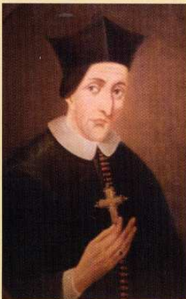
Bildnis Niels Stensen, Pfarrhaus St. Anna

Den unbestechlichen Blick behielt er auch als Seelsorger. In Denken und Glauben auf Erkenntnis der letzten Ursachen ausgerichtet, setzte er all seine Kraft für die einmal erkannte Wahrheit ein. Die katholische Kirche verehrt Stensen seit 1988 als Seligen. Heute sind Christen in aller Welt um seine Heiligsprechung bemüht.