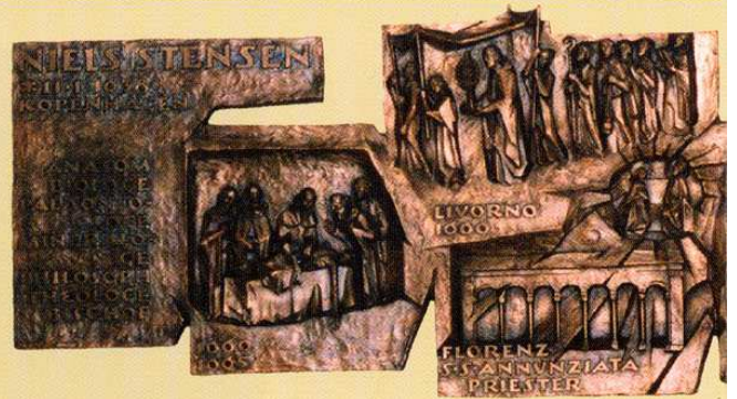
Relief zum Lebenslauf von Niels Stensen (Propstei St. Anna)