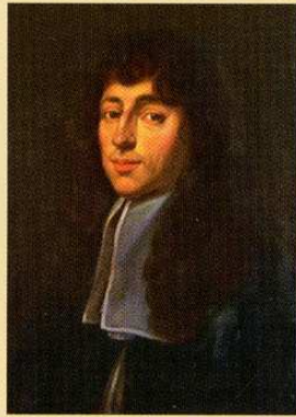
Bildnis Niels Stensen, Uffizien Florenz

Niels Stensen war als Naturforscher seiner Zeit in vielen Dingen um Jahrhunderte voraus.