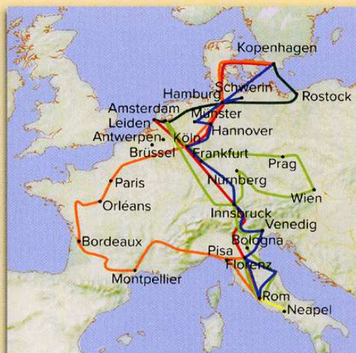
Reisen von Niels Stensen